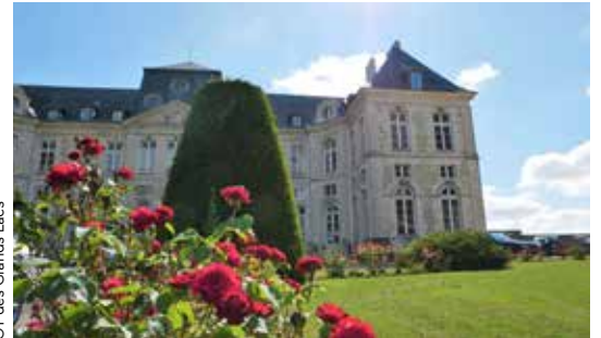
OT des Grands Lacs

Le Département a mis à l'étude la construction d'un nouveau centre routier à Vendeuvre-sur-Barse. Ainsi, il pourra libérer l'ensemble de l'ancienne bergerie du château, pour la dédier à la future structure culturelle chargée de mettre en valeur la collection de la Sainterie dont il est propriétaire. L'animation du site se fera en lien avec la commune, la communauté de communes et les bénévoles investis dans la préservation de ce patrimoine industriel.