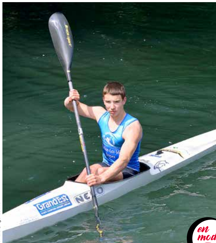
F. Marais/Agence info