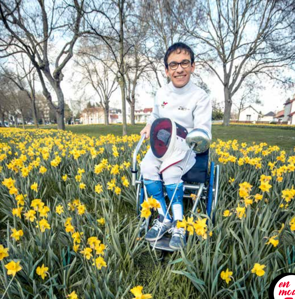
Le Bonheur des gens / TCM - Ville de Troyes