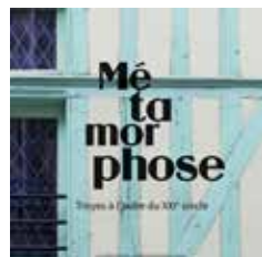
➔ Métamorphose - Troyes à l'aube du XXI e siècle. Éd. La Maison du Boulanger. 25 €.